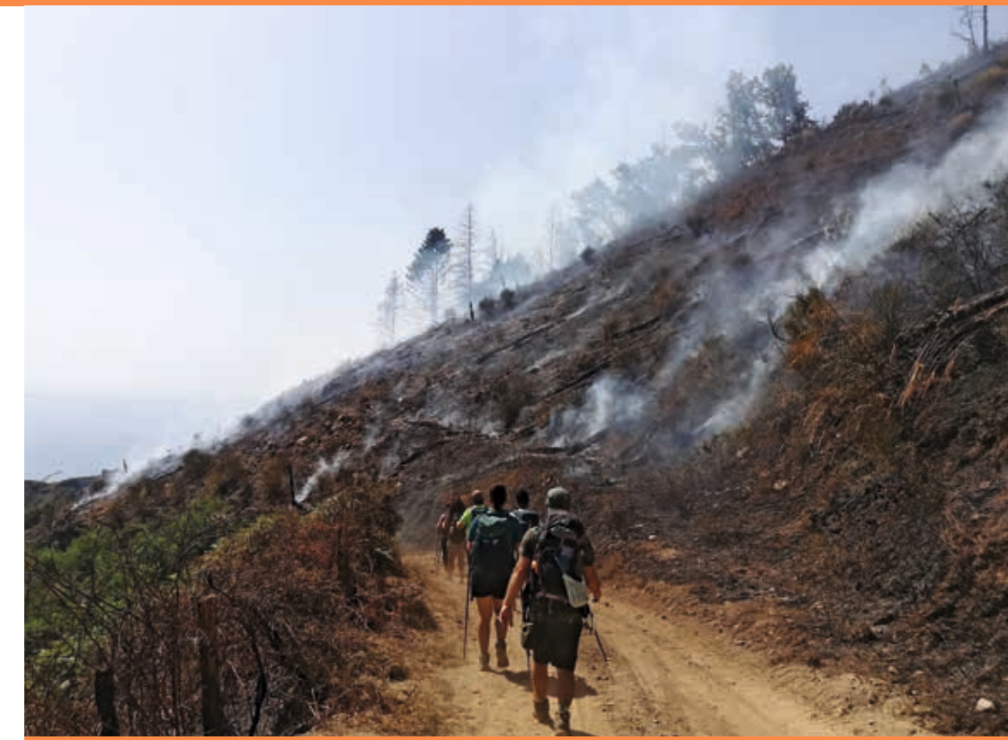
Pellegrini in transito nella pineta appena devastata dalle fiamme.