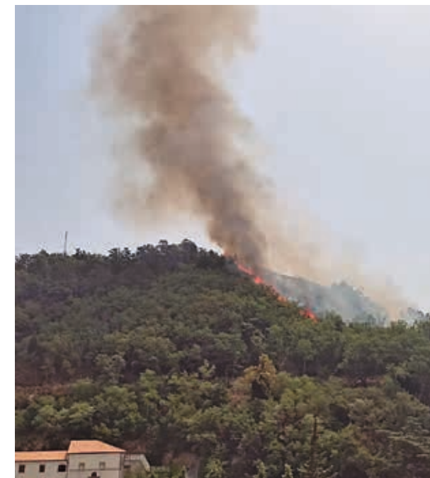
Le fiamme divorano il bosco nell'area della "Toppa San Nicola".

Cammino di San Francesco di Paola aveva recentemente realizzato una serie di iniziative, anche di minitrekking, per valorizzare la zona intorno al Santuario, particolarmente bella per la presenza di querce, macchia mediterranea, erica e ginestra, ora, purtroppo, andate in fumo. Già lo scorso anno era stato incendiato il pianoro poco distante e soltanto adesso la macchia mediterranea si stava rigenerando.