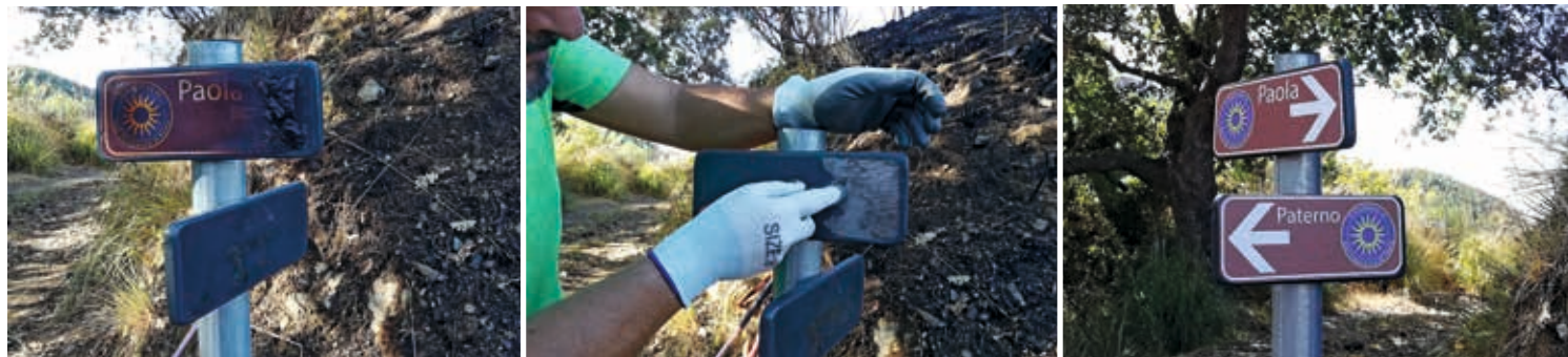
L'opera di ripristino della segnaletica, da parte dei volontari, lungo il Cammino di San Francesco di Paola.

già adoperati per ripristinare il tracciato interessato dal fuoco, spostando ostacoli e ripristinando le tabelle segnaletiche. Il percorso rimane inalterato anche sulla App ufficiale, soprattutto dopo che le piogge autunnali hanno fatto un po' di pulizia da cenere e carbone presente nelle pinete e sugli arbusti della macchia.