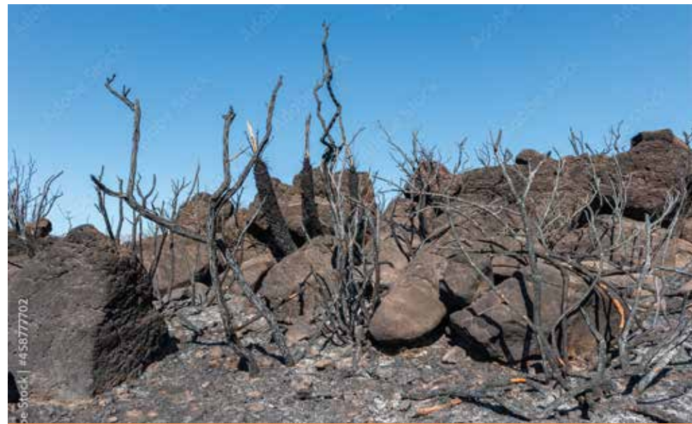
Ancora una desolante immagine del bosco dopo il passaggio delle fiamme.