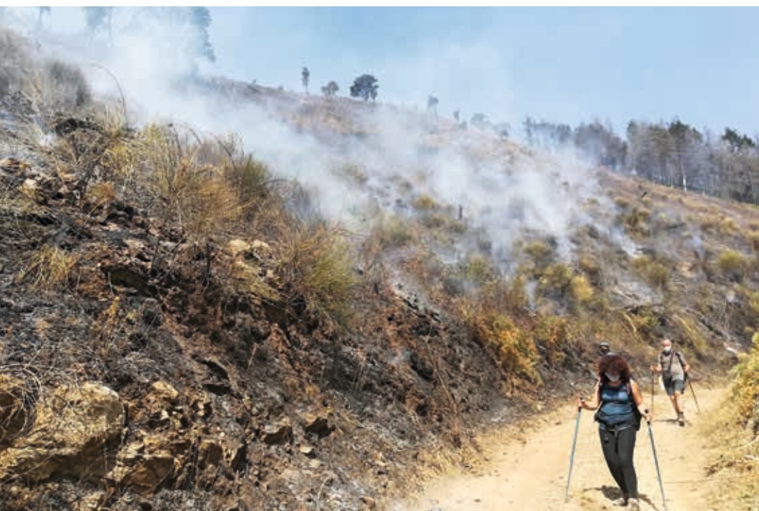
Si prosegue il cammino in una zona di macchia boschiva ancora fumante.

Al rogo della località Pitrizzi, si è aggiunto quello che ha interessato, verso metà agosto, l'area "Toppa San Nicola", di proprietà del Santuario di San Francesco di Paola, lungo la quarta tappa del Cammino, tra Paola e San Fili. In quell'occasione, essendo i mezzi aerei impegnati nei grandi incendi in Sardegna e in Aspromonte, è stato determinante l'intervento di volontari laici e religiosi (come spiegato nel box). Proprio in quest'area l'Associazione Il