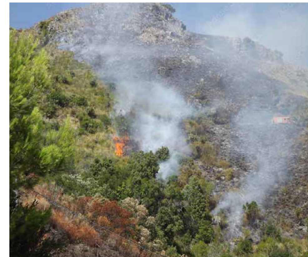
Bucia la splendida macchia mediterranea dell'Aspromonte.