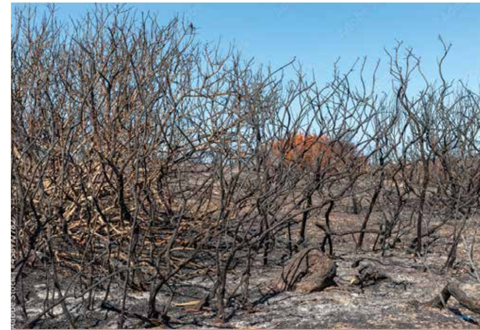
Ciò che rimane del bosco dopo il passaggio dei piromani.